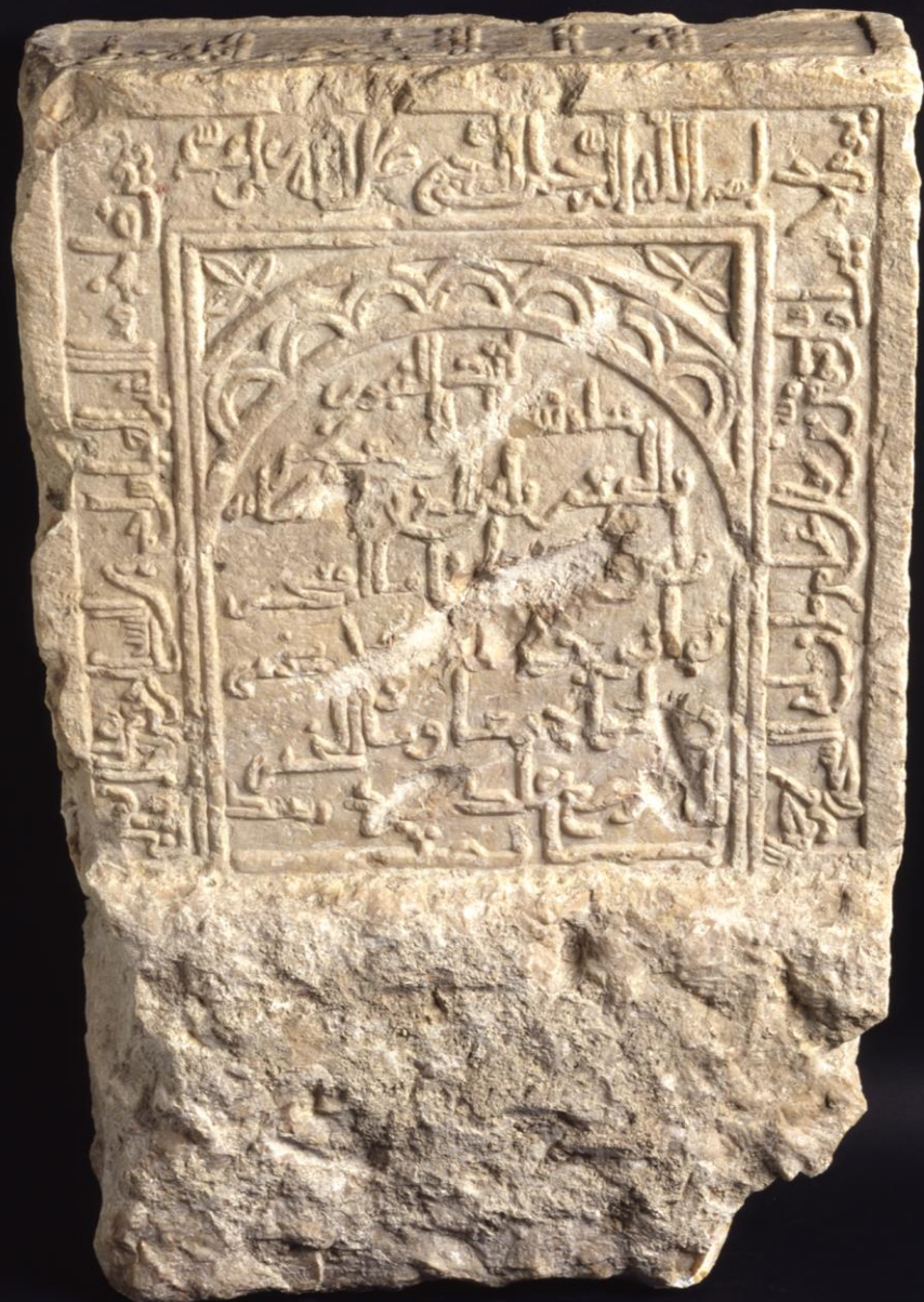
Lápide funerária dedicada a Al-Abbas Ahmad, datada de 1398

Intervenção arqueológica, Praça da Figueira, 1962 Museu de Lisboa