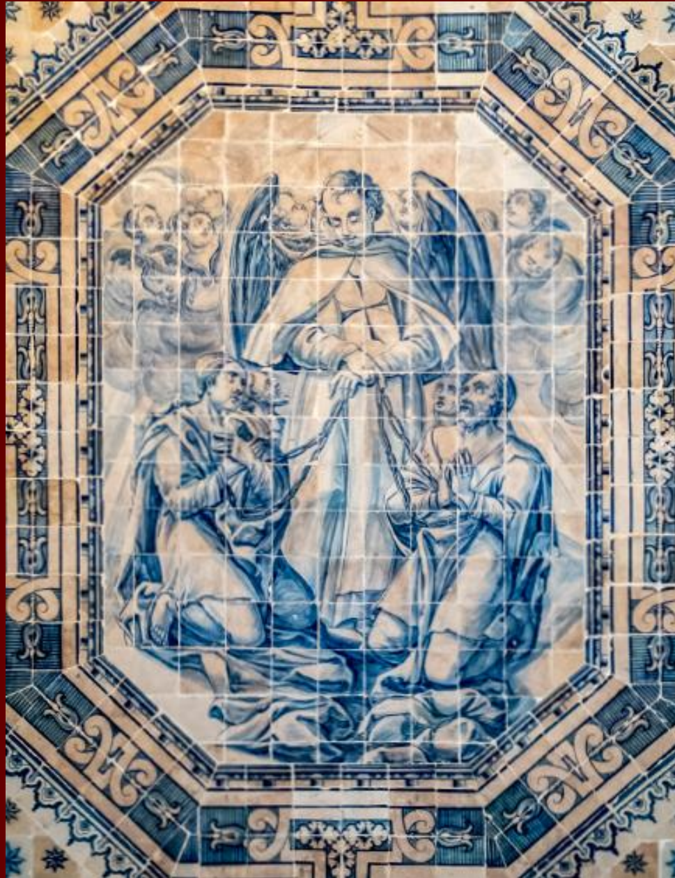
Iconografia da Ordem da Santíssima Trindade Azulejo, séc. XVIII

Convento das Trinas do Mocambo, Lisboa Instituto Hidrográfico - Marinha