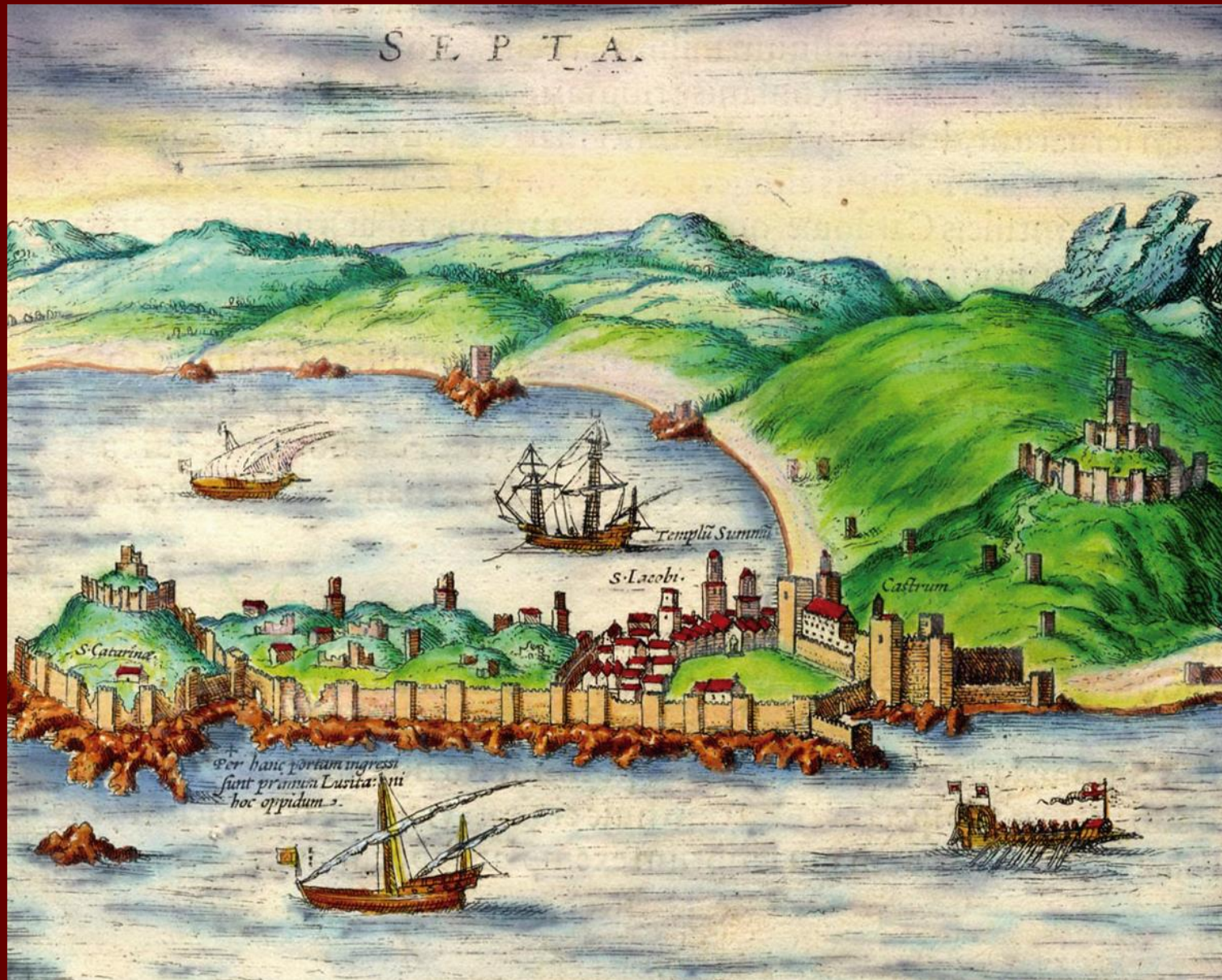
Civitates Orbis Terrarum, de Georg Braun (1541-1622).