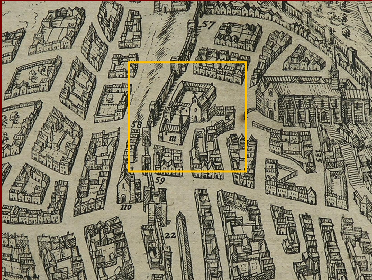
Convento da Santíssima Trindade George Braunio, Civitas Orbis Terrarum , 1598, vol. V.