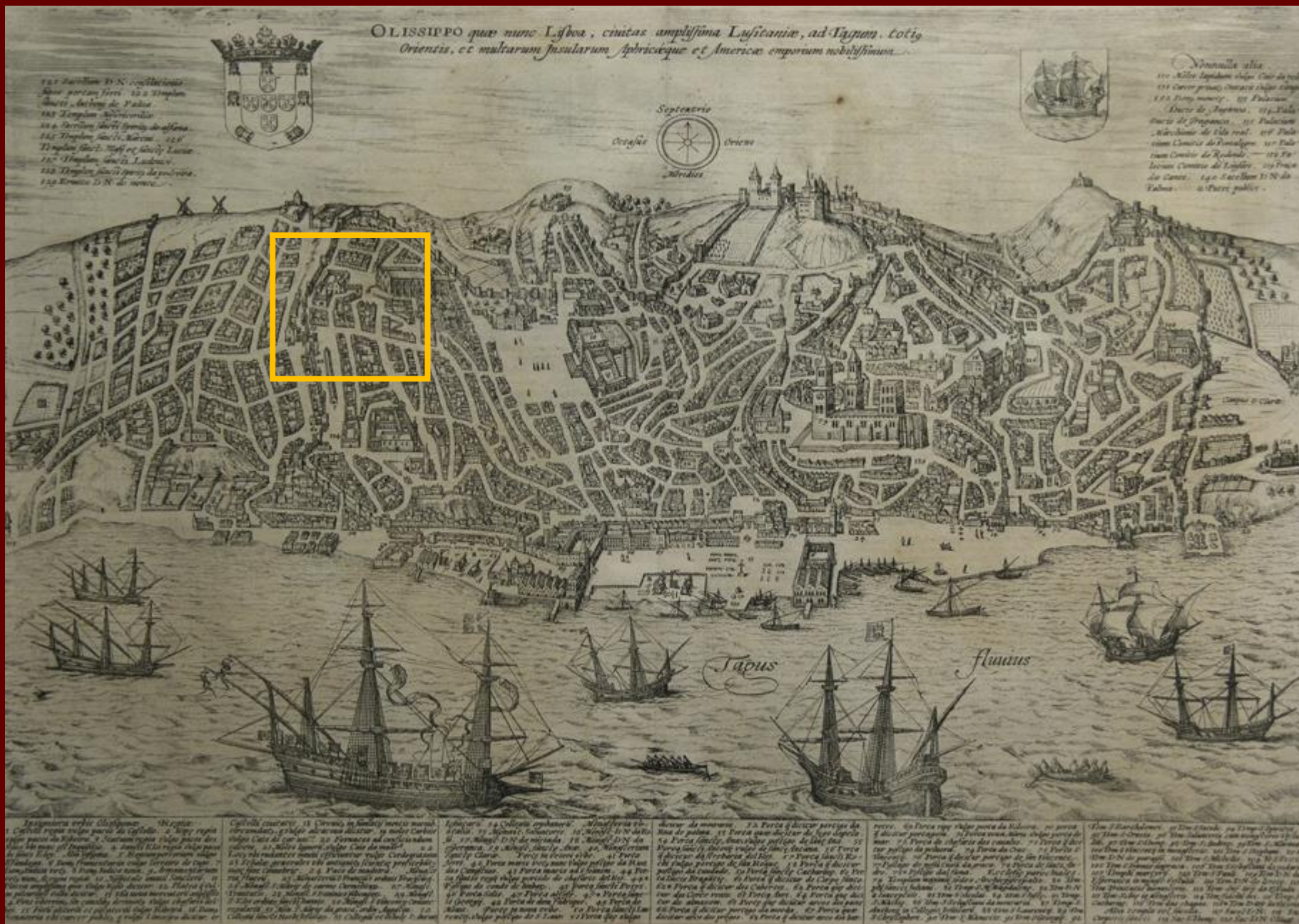
Perspectiva de Lisboa – século XVI George Brauno, Civitas Orbis Terrarum , 1598, vol. V.