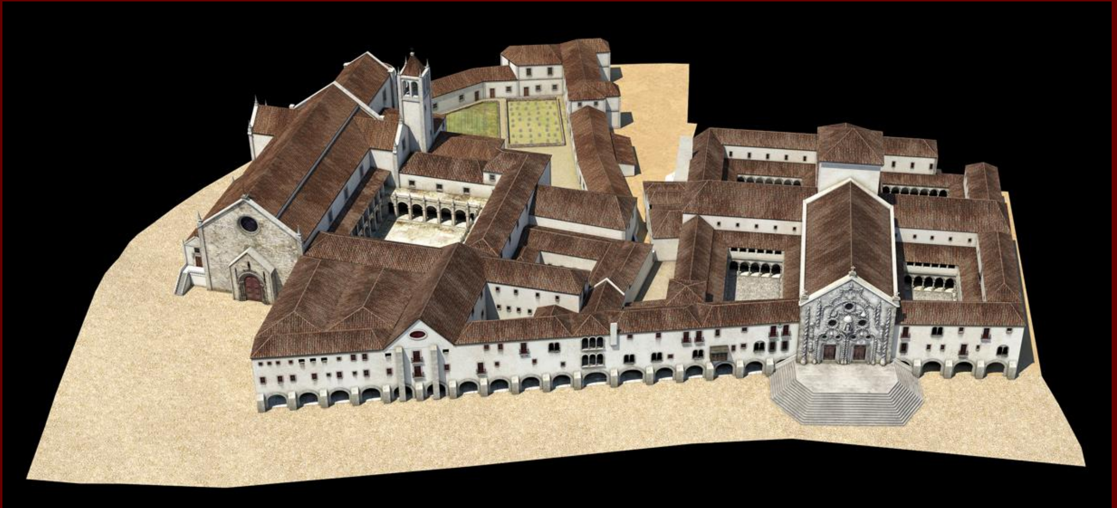
Hospital de Todos-os-Santos e Convento de S. Domingos, Rossio Reconstituição virtual 3D, 2010 Museu de Lisboa